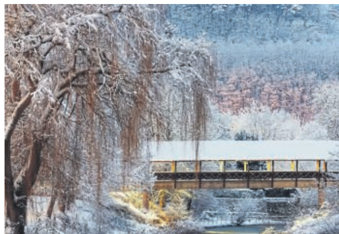
Dieses Motiv schmückt den diesjährigen Adventskalender der Mündener Lions zur Aktion „helfen und gewinnen“.

Vom 1. bis zum 24. Dezember werden täglich Gewinner gezogen und in unserer Zeitung sowie auf der Internet-